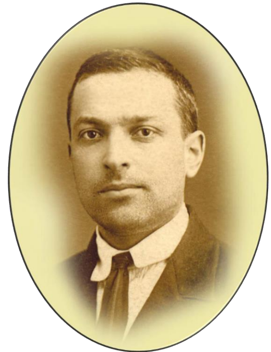
Выготский Лев Семенович (1896 – 1934) ученый-психолог, педагог