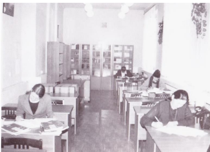
Читальный зал филиала в 90-е годы XX века