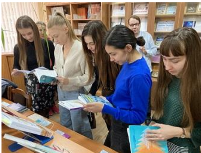
Студенты-экономисты на обзоре по выставке трудов преподавателей в читальном зале. Октябрь 2022 г.